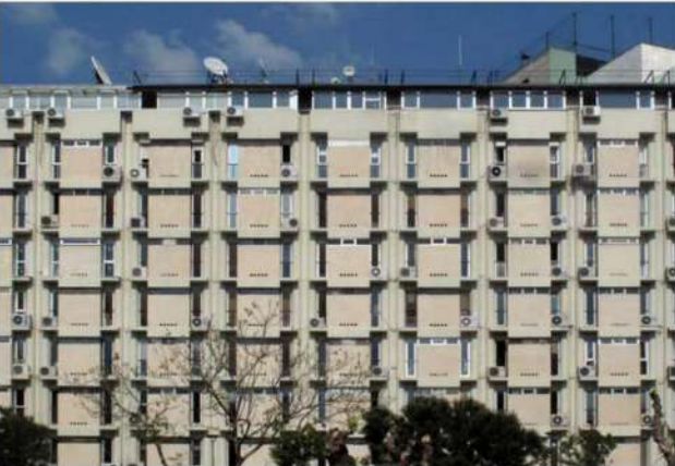
Yeni Asır İşhanı