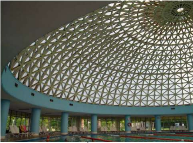
Ege Üniversitesi Olimpik Yüzme Havuzu